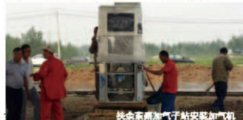
扶余东路加气站安装加气机

集团旗下昆仑燃气有限公司各个加气站进展顺利,其中扶余东路加气站的所有设备正在安装中。7月22日,扶余东路加气站罐体,安全顺利的完成吊装,25日,保质保量的完成加气机的安装,预计此站一个月左右可以对外运营加气。