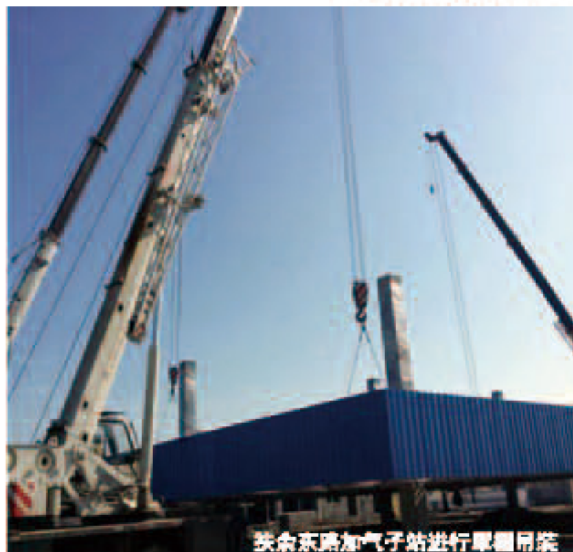
扶余东路加气站进行罐体吊装